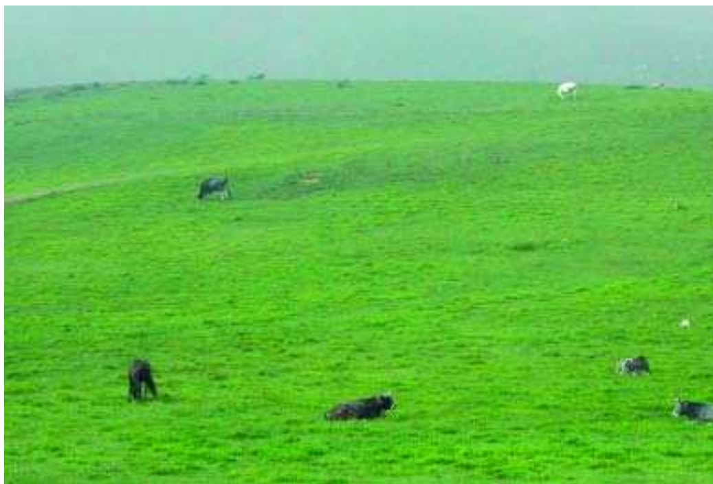
GANADO PASTANDO EN ZONA FUERTEMENTE INVADIDA DE LECHERINA.