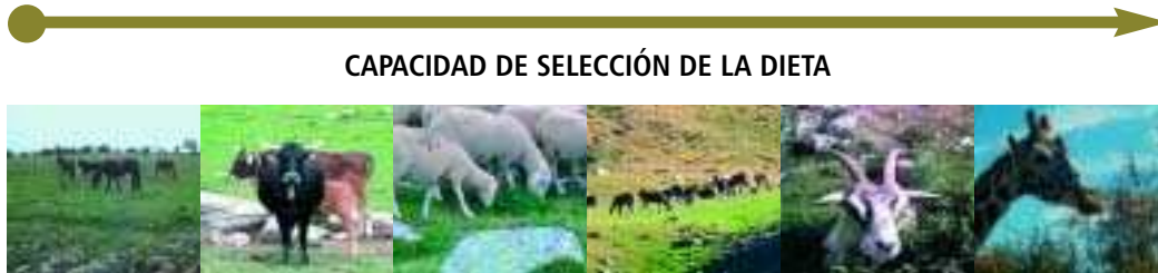
FIGURA III GRADIENTE DE LA CAPACIDAD SELECTIVA DE LA DIETA DE DISTINTOS HERBÍVOROS SEGÚN LA CLASIFICACIÓN DE HOFFMAN (1988).

último, el equino también prefiere las herbáceas, solapándose en gran medida su dieta con la del vacuno (ver Tabla I), pero su morfología bucal le permite apurar más el pasto, ejerciendo un efecto mucho más severo sobre el mismo. A su vez, la fisiología digestiva del equino, diferente de la de los rumiantes y, en general, menos eficiente en el aprovechamiento de los nutrientes, implica unas mayores necesidades de ingestión de forraje para cubrir sus necesidades, como queda reflejado en nuestros estudios en Sejos. La conducta observada por los ungulados herbívoros en Sejos respecto al consumo de la Lecherina también es variable según la especie. Mientras que ciervos y ovejas ingieren la Lecherina sin problemas aparentes, las vacas apenas la ingieren y las yeguas la rechazan totalmente. Estos diferentes comportamientos han sido explicados para otras euforbiáceas como diferentes adaptaciones, principalmente a nivel digestivo, de los herbívoros al consumo de plantas ricas en compuestos secundarios, como es el caso de la Lecherina (Kromberg & Walker, 1993). Los compuestos secundarios engloban distintas sustancias tóxicas sintetizadas por las plantas que consiguen defenderlas del pastoreo (compuestos fenólicos, terpenoides, alcaloides, etc.).