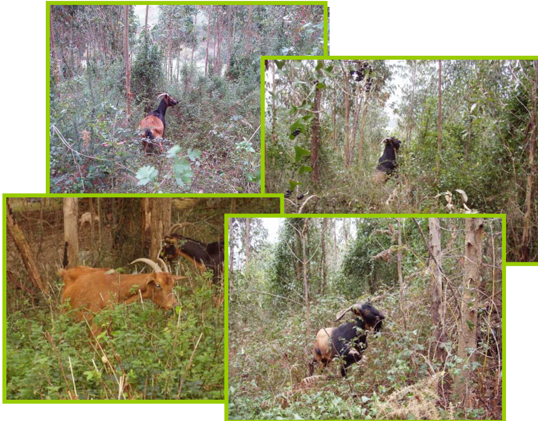
Cabras ramoneando en el eucaliptal

Sign. = Nivel de significación. e.t.d. = error típico de la diferencia.