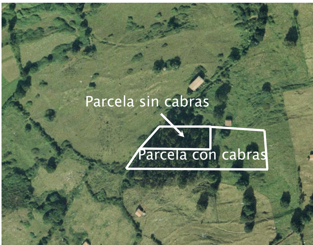
Foto 1.- Foto aérea de las parcelas experimentales

Estimación de la biomasa aérea presente. Se recogieron 5 muestras de 1 m 2 en cada uno de los 2 tipos de vegetación más representativos (escajal y zarzal) tanto en la parcela con cabras como en parcela de exclusión: 5 x 2 x 2 = 20 muestras por control. Se llevaron a cabo 2 controles: antes del comienzo del pastoreo con cabras (18 de octubre) y des-